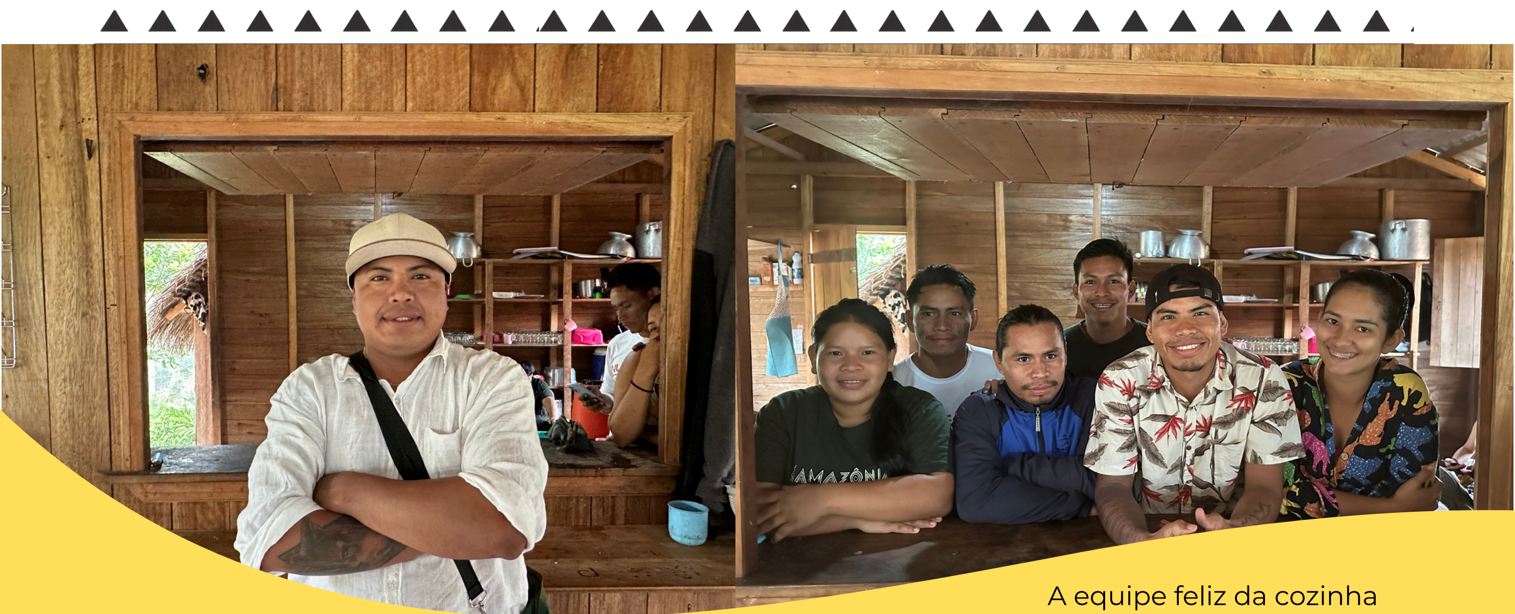
A equipe feliz da cozinha